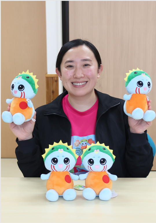
地域おこし協力隊（移住・定住促進支援員）