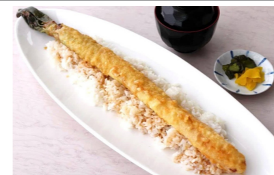
長ネギの一本天丼 1,000円 ※1日5食限定