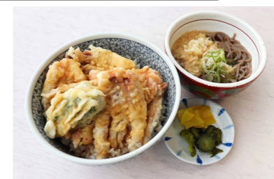
ゲン天丼とミニそばセット 1,280円 (ゲン丼単品 1,000円)