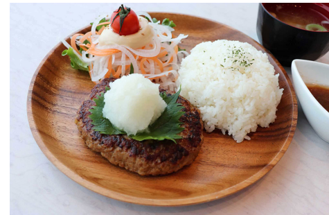
おろしそハンバーグプレート 1,380円