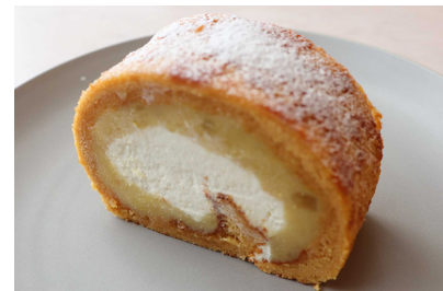
おさつロールケーキ