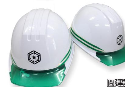
間建設課土木管理係