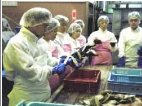
加工体験(ホタテ貝むき)