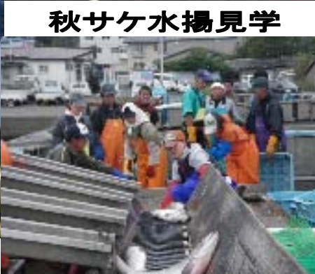
秋サケ水揚げ見学