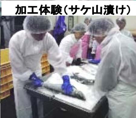
加工体験(サケ山漬け)