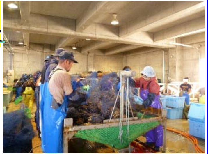
↑ 稚貝分散作業の様子 (※全長約6mmに成長したホタテを選別・放流します。)

例年、採苗器一袋当たりの稚貝数は1500～2000個が付着するのに対し、本年は500個以下と不足確実となったことから、各養殖漁家では町外他産地から不足分を補いました。