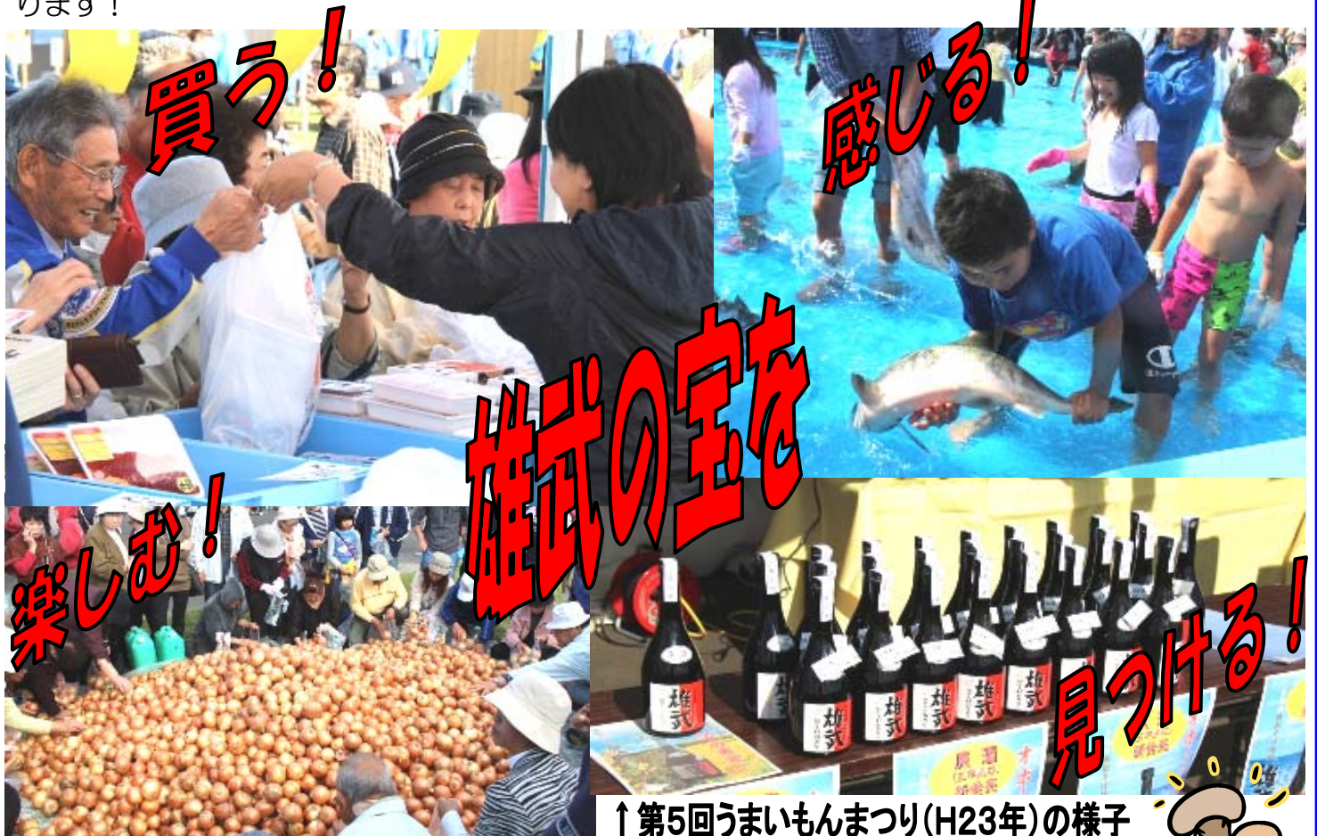
↑第5回うまいもんまつり(H23年)の様子