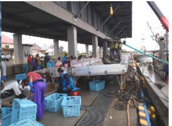
← 元稲府漁港水揚げ・選別の様子