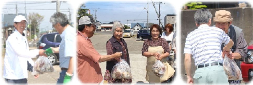
漁師さんや漁協・役場職員等たくさんの人たちによる頑張りもありました！