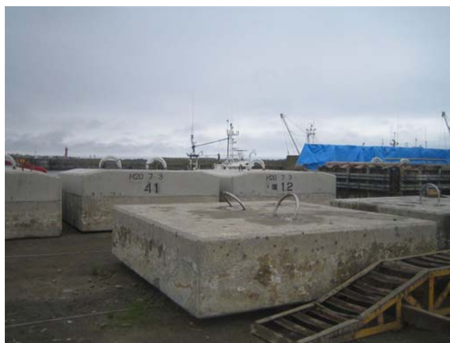
手前が引揚げられた15tブロック 奥が嵩上げされた24tブロック