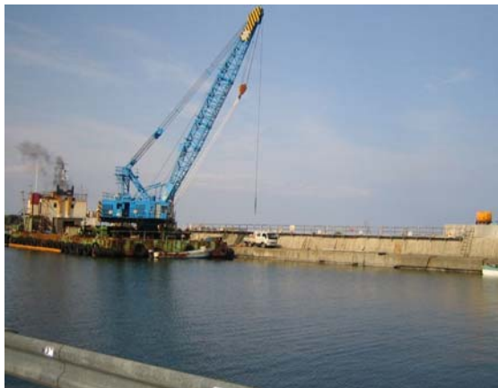
(沢木漁港での工事の様子)

現在、雄武町では4つの漁港全てで整備工事が行われています。今回は、各漁港の整備状況についてお知らせしたいと思います。