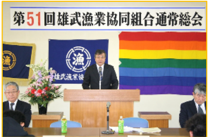
第51回雄武漁業協同組合通常総会

平成26年の事業計画については、ホタテ漁を16億5千万円（15,000t）と設定し、総額で40億円を見込んでいます。