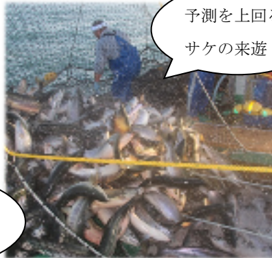
予測を上回る サケの来遊！