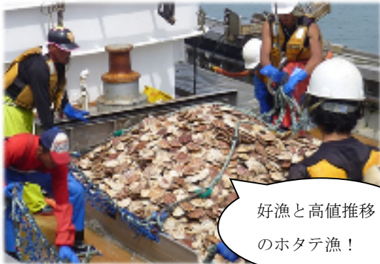
好漁と高値推移 のホタテ漁！