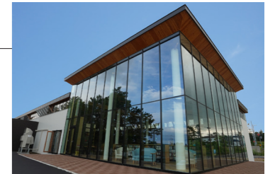
雄武町図書館（雄武町末広町二区）