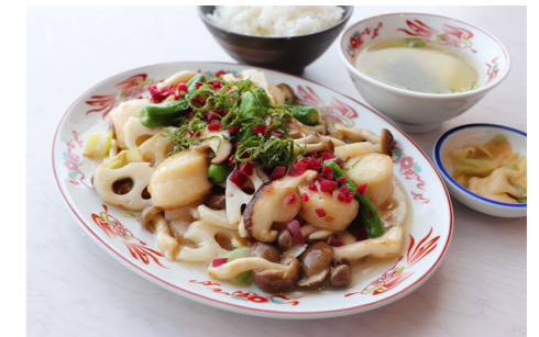
●帆立の梅肉炒め 1,280円