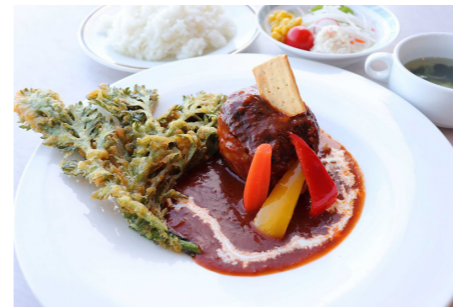
●チーズ入り煮込みハンバーグ 1,380円