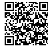
↑ 内閣府ホームページ