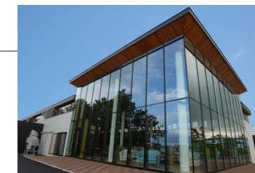
雄武町図書館（雄武町末広町二区）