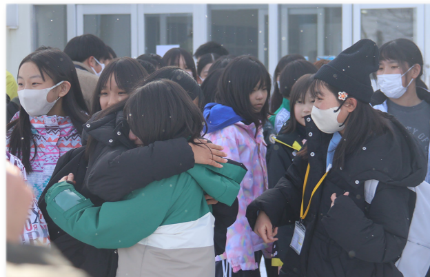
↑別れを惜しむ児童たち

2月3日から3日間の日程で、佐賀県武雄市訪問団の児童11人、引率者3人が来町しました。町民センターで歓迎会が行われ、町長や町関係者から歓迎の言葉が贈られ、武雄市児童からは歌の披露が行われました。また、雄武小学校で行われた学校交流では、雪国ならではの雪山滑りなどで、雪にまみれながら冬遊びを満喫していました。最後は別れを惜しみながら、大きくなってからの再会を誓い、互いの絆を深めていました。