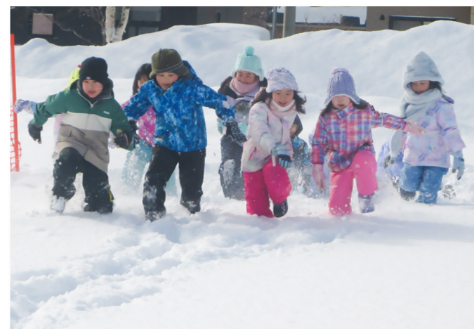
↑スノーフラッグの様子

旭日公園で「こども冬まつり」が開催されました。前夜祭では、同所で開催されたおうむキャンドルナイトのあたたかな灯に照らされた中で、児童によるハンドベルの演奏が披露。最後に、花火が冬の夜空を彩りました。本祭では、スノーモービルやスノーフラッグなどのアトラクションのほか、あたたかいお雑煮やサンドイッチなどが振る舞われました。子どもたちは寒さに負けず、元気いっぱい冬を楽しんでいました。