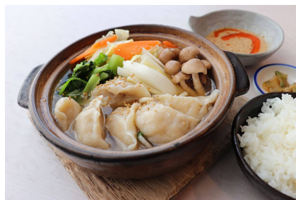
たんたん 担々水餃子 1,080円