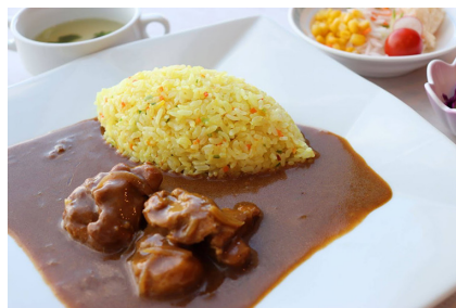
マッサマンカレー 1,280円