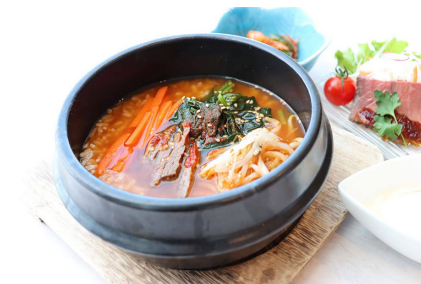
ユッケジャンクッパ 1,280円

雄武町民 2名以上のご利用 おひとり様5,000円 (1泊朝食付き) 雄武町民以外 雄武町民と一緒に2名以上 おひとり様6,000円 (1泊朝食付き) 町民プラン特典 レストラン藍ご利用のお客さま、全品20%割引とさせていただきます。 ※1名利用は3,000円増となります。 ※和洋室は1名2,000円増となります。 ※リニューアルルームは1名500円増となります。 ※小学生以下は、大人の料金の70%となります。