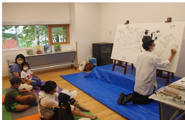
↑リクエストされた動物を描いていく谷口氏（右）

雄武町図書館「雄図びあ」で絵本作家の谷口智則氏による壁画制作と絵本の読み聞かせ、ライブペインティングが行われました。17日は、幼児用のおはなしのへやの入り口にご自身のキャラクターや雄武町で見た動物、景色を交えた壁画を描き、18日は、体験型絵本などで子どもたちと交流をしたり、ライブペインティングでは、参加者からリクエストされた32種類の動物を描いたイラストが作成されました。作品は、視聴覚コーナーに飾られていますので、是非お立ち寄りください。