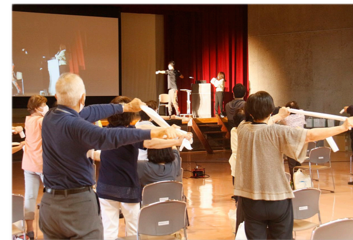
↑手ぬぐいを使った体操をしている様子

講話では、認知症の原因や防ぐためのポイントなどについての話しがあり、また、体操では地域活動支援センター「ココカラ」で作成された特製手ぬぐいが配布され、手ぬぐいを使ったストレッチなどが行われました。参加者からは「家でもできる簡単な体操だから、これからも続けていきたい」と話していました。