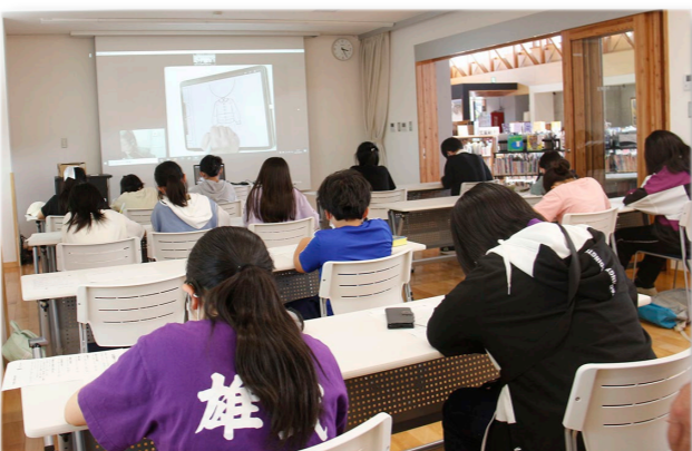
↓イラスト講座の様子

演奏以外にも、各楽器の紹介、披露した曲や作曲家の説明、生演奏のイントロクイズなども行われ、生徒たちを楽しませました。