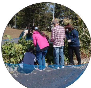
↑ココカラ農園のお手入れ