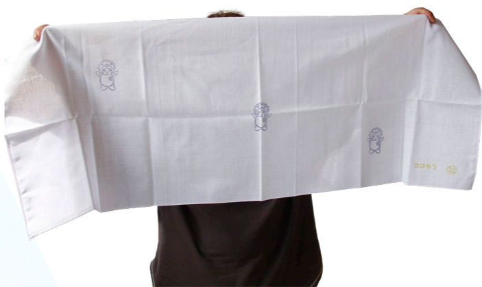
↓特製スタンプ入り手ぬぐい