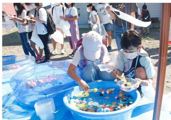
↑スーパーボールすくいに熱中する児童たち

お祭りの露店では、射的やスーパーボールすくい、綿あめなどのおなじみの屋台のほかに、まき割りやスラックラインの体験コーナー、紫外線で固まる樹脂「レジン」を使ったキーホルダーづくりなどが行われ、児童たちは目当ての露店に並び祭りを堪能していました。参加した児童は「スーパーボールすくいポイを破らないでたくさんの景品がとることができた」と笑顔で話してくれました。最後は、参加した児童たちにそうめんが振舞われてお祭りを締めくくりました。