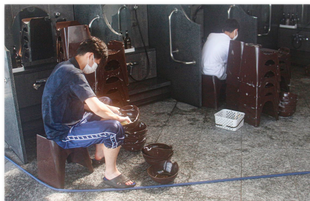
↑風呂桶やイスの洗浄をしている様子

雄武町役場では、町内の基幹産業などについて学ぶことを目的として、若手職員を対象に基幹産業研修を行っています。今年、ホテル日の出岬において、大浴場の清掃、客室の清掃やベッドメイキング、接客などの業務を体験し、おもてなしの心を学びました。研修に参加した職員は「今回の研修は貴重な経験となりました。今回、学んだことをこれからの業務などに活かせるよう頑張ります」と話していました。