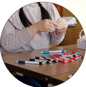
↑いくらすじ子ボールペンのチャーム制作と取付