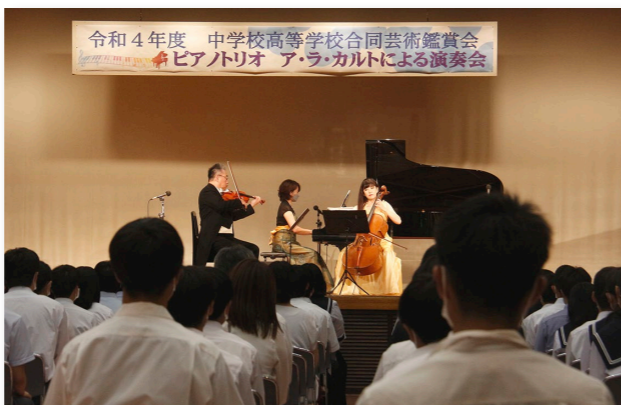
↓合同芸術鑑賞会の様子