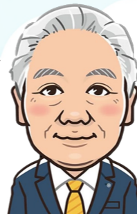
雄武町長 石井友藏