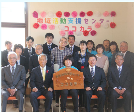
↑令和3年10月1日ココカラ開所式

令和4年10月1日、地域活動支援センター「ココカラ」が開設されてから1周年を迎えました。