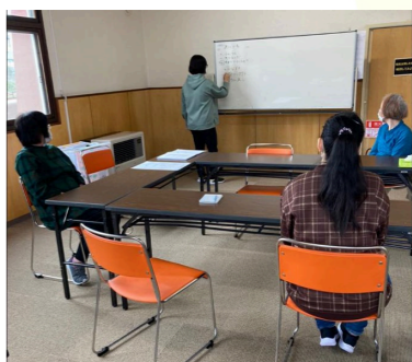
↑コミュニケーション勉強会