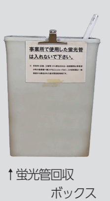
↑蛍光管回収ボックス