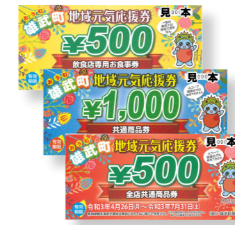
(商工費) 新型コロナウイルス感染症対策「地域元気応援券」事業