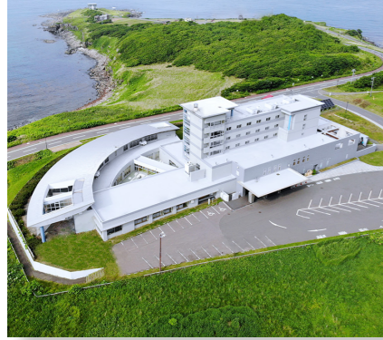
(総務費) ホテル日の出岬施設整備事業