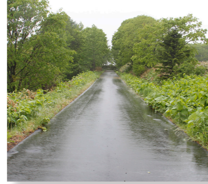
(土木費) 町道舗装整備事業