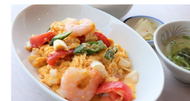
◎トマトと玉子のふわふわ炒め 1,000円