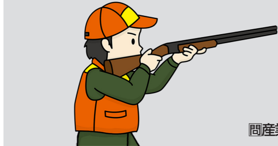
間産業振興課林務係