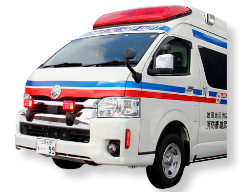
(消防費) 消防車両更新事業