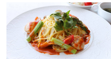
◎アスパラと帆立のパスタソース・アメリカヌ 1,500円