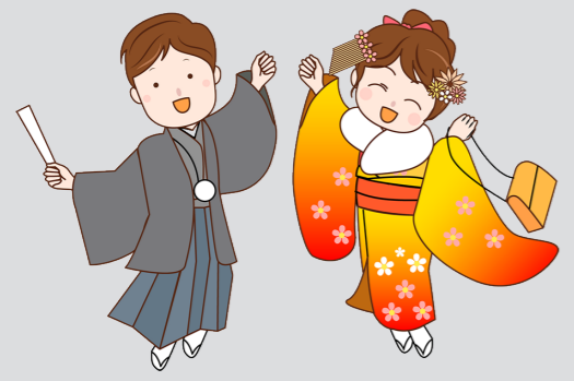
問教育振興課生涯教育係

今年度の「20歳の集い」は令和5年1月8日に予定しており、参加対象は平成14年4月2日から平成15年4月1日までに生まれた人です。対象者には、町から案内状を12月までに送付します。