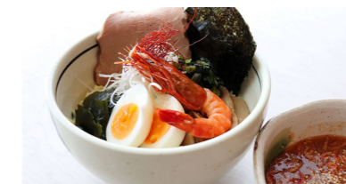
◎海老味噌つけ麺 1,000円