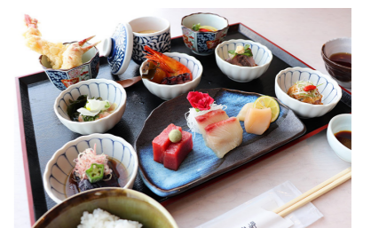
◎日の出御膳 3,000円 ※土・日各5食限定