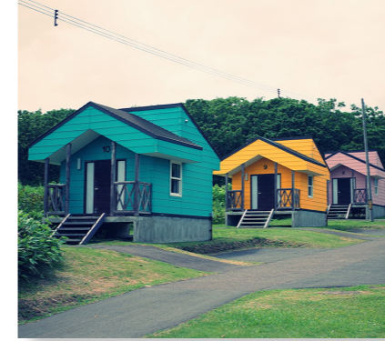
(商工費) 観光施設維持管理事業