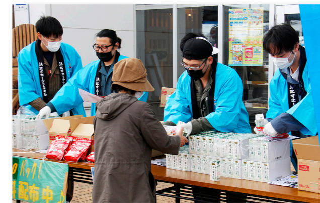
↑牛乳の無料配布の様子

新型コロナウイルス感染症の影響により、全国的に消費量が落ち込んでいる牛乳・乳製品の消費拡大を目指し、牛乳の無料配布が行われました。地域交流センター前で北オホーツク農業協同組合の青年部員が、牛乳・乳製品をいつもより1つでも多く摂ってもらうように、町民や施設の利用者一人ひとりに「消費拡大のご協力をお願いします」と呼びかけながら、牛乳とスキムミルクを手渡していました。