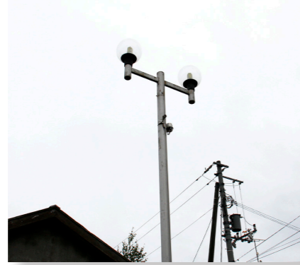
(総務費) 街路灯LED化整備事業