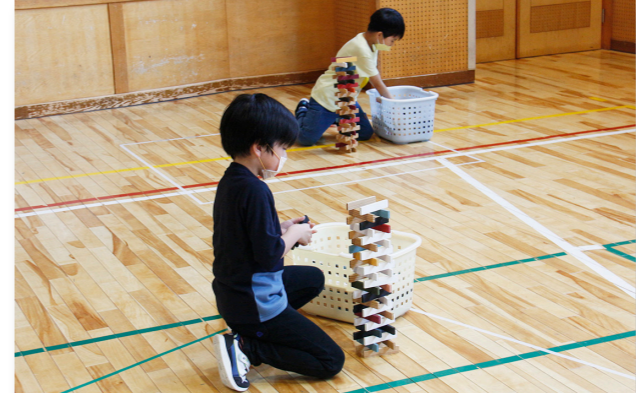
↑カブラ井型積みに挑戦する児童 *カブラブロック:「ワンサイズの板」を積み重ねて色々なものを表現できるフランス生まれの木製ブロック

この日、風の子児童センターでこどもおたのしみ会が行われました。おたのしみ会では、児童が、制限時間内に小さいスプーンでピンポン玉をより多く運ぶ「ひやひやピンポン」や*カブラブロックを井型に組んで積み上げた高さを競う「カブラ井型積み」などの種目にそれぞれ挑み、ベスト記録を目指して白熱した展開をみせていました。カブラ井型積みでは、途中で崩れてしまう場面もありましたが、制限時間いっぱいまであきらめず、より高く積み上げられるよう工夫して挑戦していました。