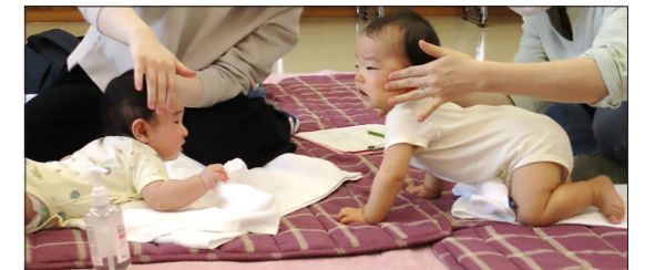
↑タッチケアの様子