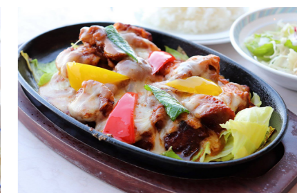
●鉄板チーズダッカルビ 980円