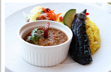
●スパイシーキーマカレー 1,080円