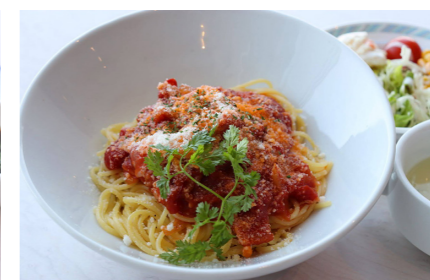
●スパゲッティ アマトリチャーナ 980円