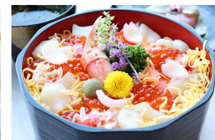
●雄武産いくらたっぷり海鮮ちらし 3,000円(1日5食限定) ※ご予約も承ります。