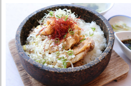
●石焼き油淋鶏飯 1,180円