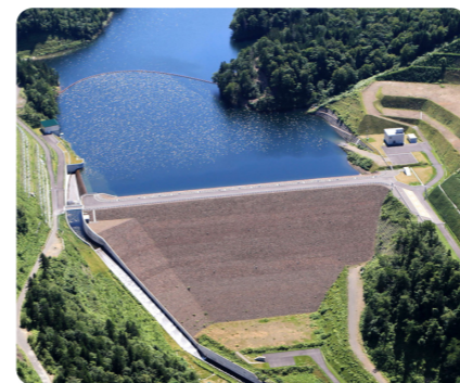
基幹水利施設管理事業