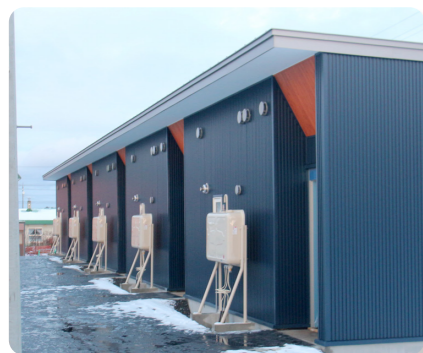
公営住宅整備事業