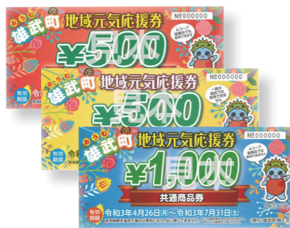
新型コロナウイルス感染症対策「地域元気応援券」事業