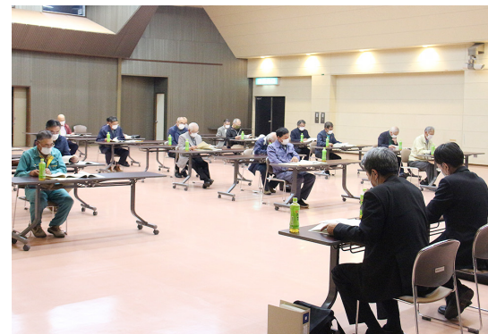
10月12日に自主防災組織の設置などに関する説明会を実施

なお、避難所運営体験だけでなく、自主防災組織を設置するための説明に担当職員が参加することも可能ですので、これらを希望する自治会は、住民生活課住民活動係まで連絡をお願いします。