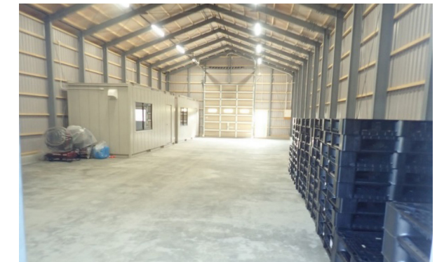
↑災害備蓄倉庫（内観）