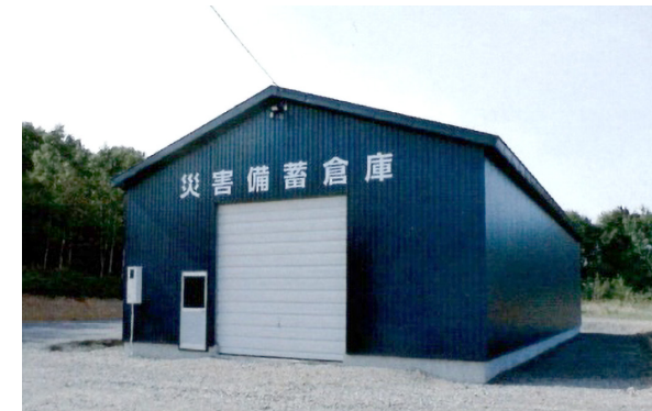
↑災害備蓄倉庫（外観）