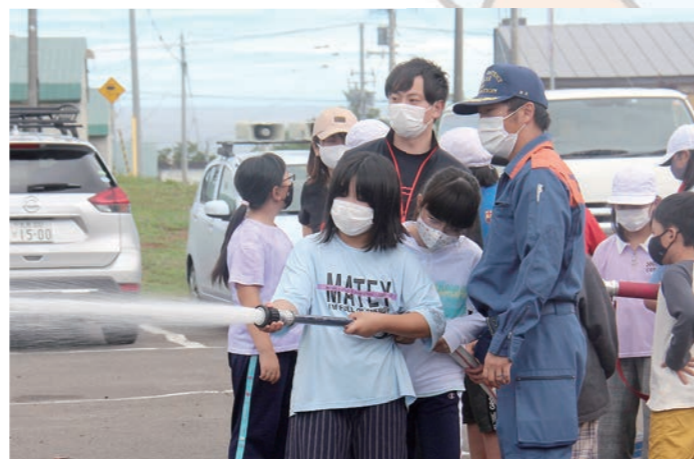
↑ 消防体験で放水する児童

各学年にわかれて実施された授業では、装置を使った地震体験や消防体験、避難所に必要な段ボールベットの設営などの多彩な内容となっており、児童は体験学習をとおして防災への関心と理解を深めていました。