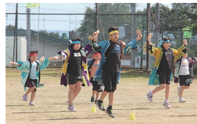
↑ 沢木小学校運動会の様子