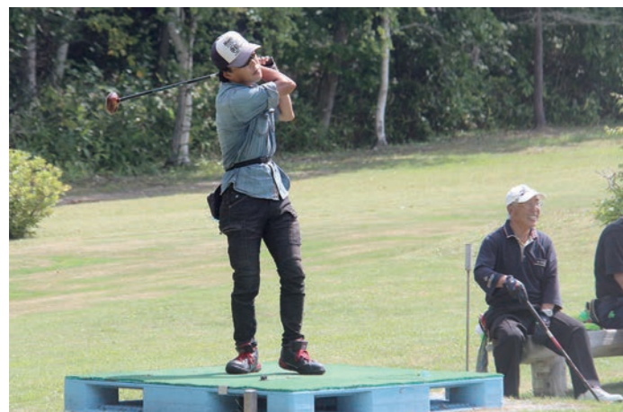
↑ ホールに目掛けてナイスショット