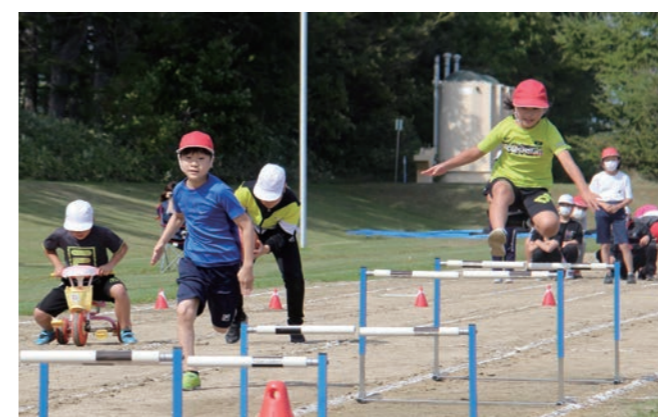
↑ 雄武小学校運動会の様子