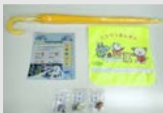
岡住民生活課住民活動係 岡教育振興課教育総務係