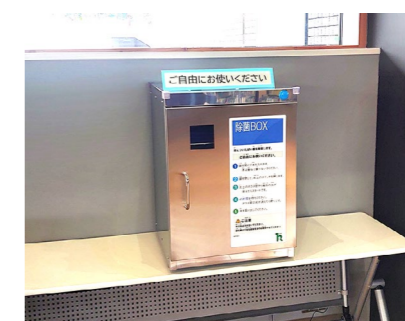
↑設置した除菌ボックス