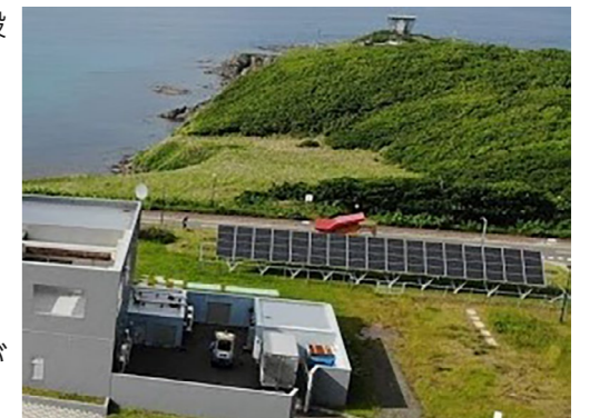
太陽光発電設備（ソーラーパネル）

令和元年度は、平成30年度より重油単価が若干下がったという要素があるものの、間違いなく使用量の削減に大きな効果が現れております。今後もホテル運営に有効活用してまいりたいと思います。