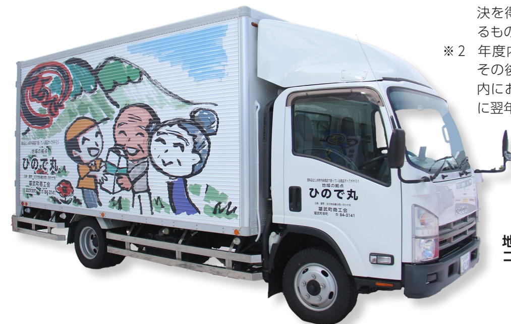
地域の拠点における購買・福祉・コミュニティ機能向上事業 予算額 1,325万円

※2 年度内において支出負担行為を行い、その後の避け難い事故のためその年度内において支出が終わらなかった場合に翌年度に繰り越して使用するもの