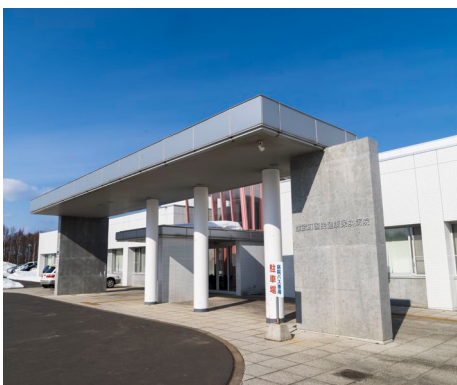
↑雄武町国民健康保険病院

◎近隣の医療機関では担えない先進的医療が必要な町民が、都市部の大病院や総合病院での先進的な医療を受けることが可能となるような交通施策の創設に向け、調査・研究を進めてまいります。