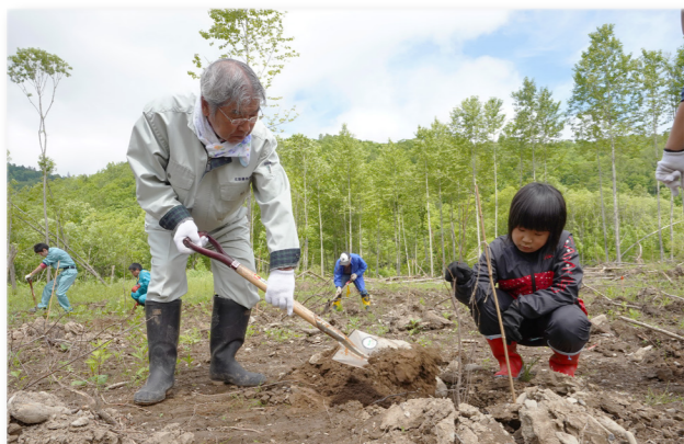
↑晴れ渡る空のもと、汗を流しながら植樹をする参加者

この日、北の魚つきの森（上幌内）で町民や林業関係者など46人が参加し、アカエゾマツ120本やナナカマド75本など5種370本の木が植えられました。当日は天気良く、参加者は汗を拭きながら一本一本丁寧に植えていました。北の魚つきの森は、魚などの生息環境を守る必要性の高い流域として北海道が認定するもので、今回植樹された木々が大きく育ち川や海を豊かにします。