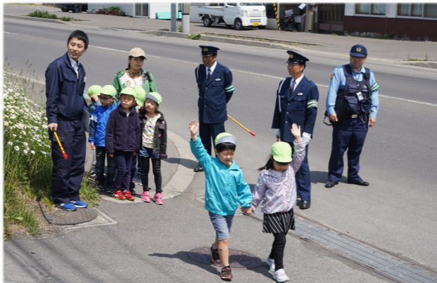
↓警察官や交通指導員に見守られながら横断する園児