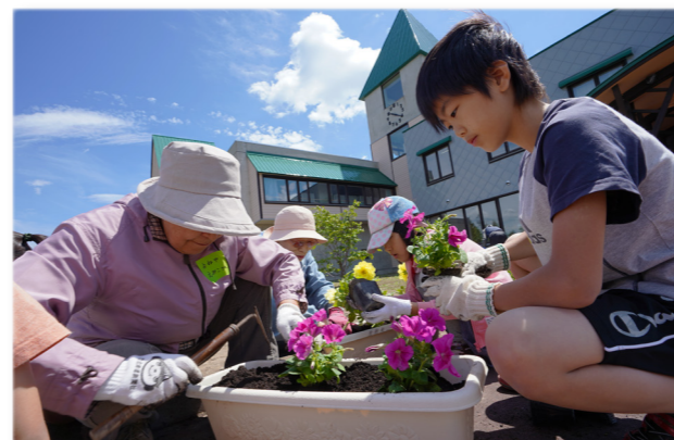
↑会員の皆さんに教わりながら花を植える児童

児童と長寿クラブの交流を深め合う世代交流会が、風の子児童センターで開催されました。児童は長寿クラブ会員に教わりながら4種類の花をプランターに植えました。花植え作業中には「綺麗に植えられたね」などと会話する場面もあり楽しんでいる様子でした。花植えを終えた後には、おやつを食べたり、児童センター職員の用意したゲームなどで交流を深めました。今回植えた花は児童センター正面通路に飾られています。