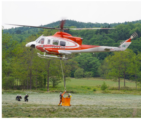
↑散水用バケツに給水を行う北海道防災ヘリコプター