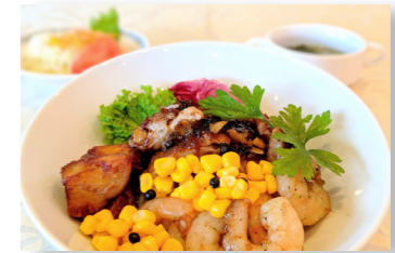
ガーリックシュリンプとチキンのパワフル丼 (スープ、サラダ付) 980円

7月といえば【土用の丑の日】今年も27日です。鰻でスタミナ補給と天婦羅蕎麦の豊富なルチンで夏を元気に過ごしましょう！