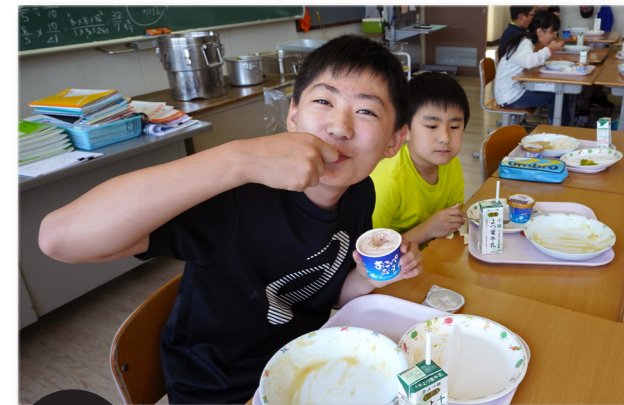
↓給食のアイスに笑顔がはじける児童（雄武小学校6年生）