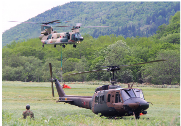
↑自衛隊の協力による消火活動