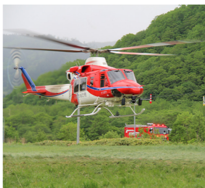
↑上空からの確認に飛び立つ札幌市消防局ヘリコプター

今後は、関係各課による災害情報連絡室に移行し、出火原因や焼損面積などの情報収集に努めます。