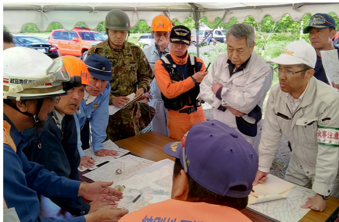
↑関係各署が現地で打ち合わせをする様子