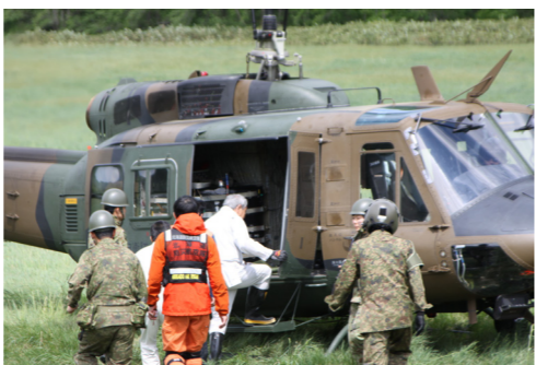
↑上空からの確認に向かう町長