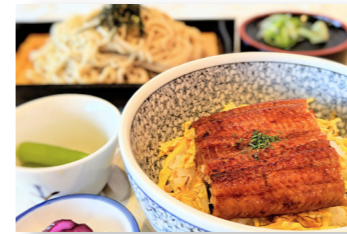
うな丼と天婦羅蕎麦セット 1,480円 (小鉢、漬物付)

7月といえば【土用の丑の日】今年も27日です。鰻でスタミナ補給と天婦羅蕎麦の豊富なルチンで夏を元気に過ごしましょう！