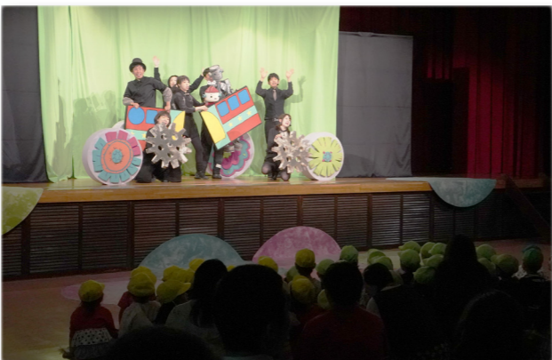
↓音楽に合わせて歌や踊りを披露する劇団員

若草保育所でこぐまクラブが開催されました。5月に保育所内で予行練習をした園児たち、この日は外に出て警察官や交通指導員に見守られながら、横断歩道などを安全に渡る練習をしました。園児たちは左右を何度も確認し、しっかりと手をあげて横断歩道を渡っていました。練習が終わった後にはパトカーの体験乗車や記念撮影が行われ、初めて乗るパトカーに園児たちは大興奮な様子でした。