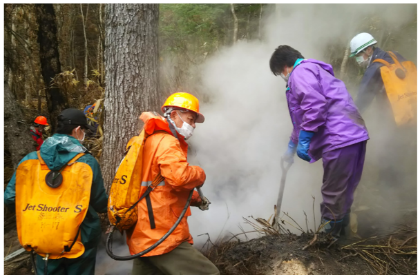
↑地上からの消火活動