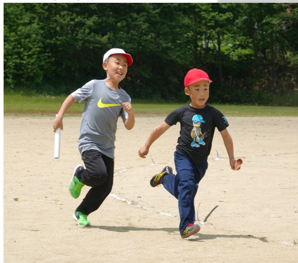
↓リレーで懸命に走る児童

若草保育所園児、町内各小学校低学年を対象とした芸術鑑賞会が町民センターで開催され、劇団「トランク機械シアター」が人形を使った演劇を披露しました。披露した作品にはみんなが一緒に歌って踊れる音楽もあり、大いに盛り上がりました。演劇の後には演者と子どもたちの交流する時間が設けられ、人形に触れたり、一緒に写真を撮ったりするなど時間いっぱいまで楽しんでいました。