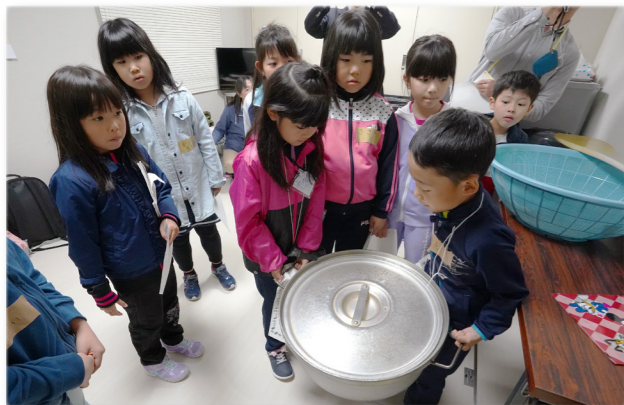
↑給食センターで鍋の大きさや重さに驚く児童

沢木・共栄・豊丘小学校の合同で社会見学が行われ、風の子児童センターや給食センターなど4か所を見学しました。給食センターでは、普段は見ることのない調理の様子を見学したり、給食を作るための大きなへらや鍋を持たせてもらいました。また、食缶（給食専用の容器）に分けられていく給食を見た児童からは「食べたい」「美味しそう」などの声が上がっていました。