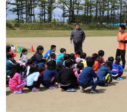
(教育費) スポーツ教室推進事業