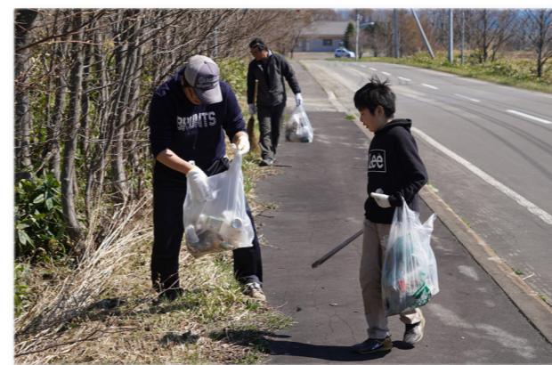
↑道端のゴミを拾う参加者

宮下町婦人部と宮下町子ども会主催による、宮下町クリーン作戦が行われました。この日、集まった12人で宮下町と風の丘スキー場周辺のゴミ拾いを行いました。春になり雪の下に埋もれていた空き缶やたばこの吸い殻など多くのゴミが現れ、ゴミ拾い終了後には45ℓの袋が10袋以上になり、皆さん驚いていました。参加者は「地域が綺麗になって、ポイ捨て防止につながれば」と話していました。