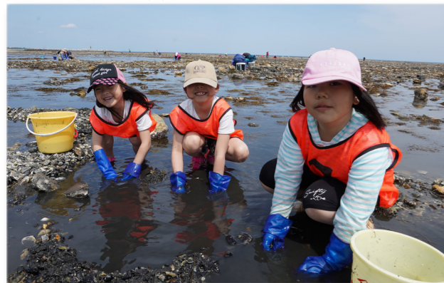
↑砂の中に隠れるアサリを探す子どもたち

子ども育成会が主催する春季めだか塾「磯遊び」が開催され、町内の子どもや保護者など約60人が参加しました。天候に恵まれたこの日、この季節には珍しく夏日となり、子どもたちは気持ちよさそうに磯で遊んでいました。磯にはアサリや小さなカニなど、いろんな生きものが隠れていて、子どもたちは砂の中を探してみたり、大きな石を動かしてみたりと楽しんでいました。磯遊びを楽しんだ後は、保護者が作ったシーフードカレーを食べてお腹も思い出もいっぱいでした。