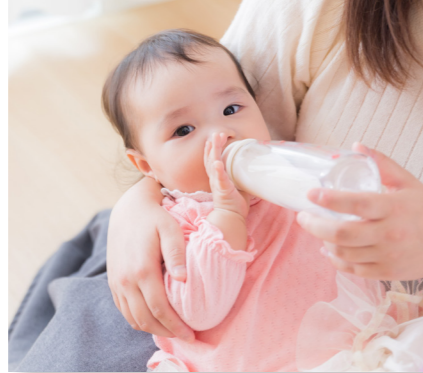
(衛生費) 母子保健事業