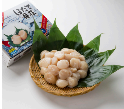
(総務費) ふるさと応援事業