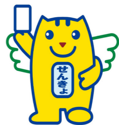
明るい選挙キャラクター 選挙のめいすいくん

4月21日(日)雄武町議会議員選挙が執行され、定数10人に対し、新人を含む12人が立候補しました。当選者別の得票数は次のとおりです。