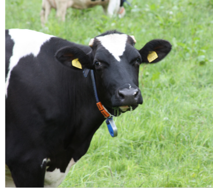
(農林水産業費) 酪農ヘルパー制度強化推進事業