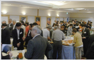
↑ 昨年の交流会の様子

●その他 会場までの送迎バスを運行します。利用する場合は申し込みの際に申し出ください。