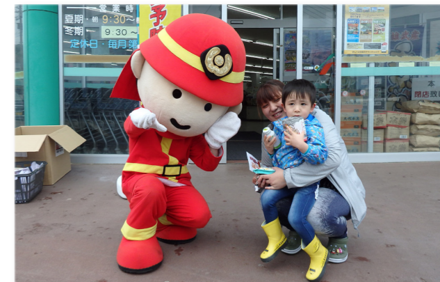
↓全国消防イメージキャラクター消太くんと写真を撮る親子