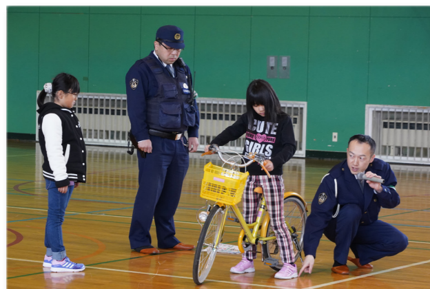
↑自転車に乗る時の注意点を説明する様子

雄武小学校体育館で1年生から3年生を対象として、興部警察署による交通安全教室が行われました。事故に遭わないよう、交通ルールや自転車の乗り方、整備について説明があり、クイズ形式の場面では元気に答えていました。教室を終えた児童たちは「車に気をつけます」と話していました。