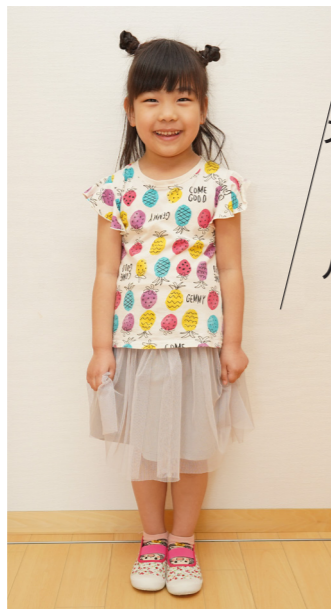
プリーク☆ アウインフル