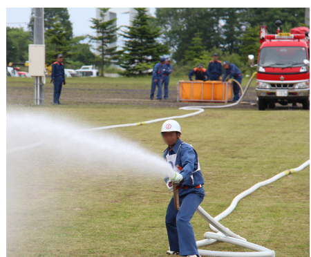
↑ 平成26年度実施時の様子