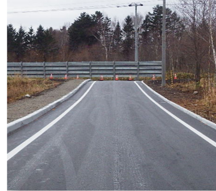
(土木費) 町道整備事業