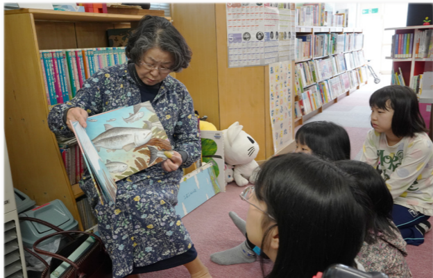
↓真剣に聞き入る児童