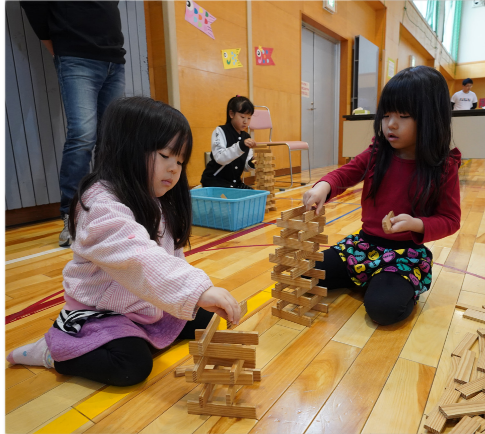
↓カプラ積み挑戦する子どもたち

町教育委員会主催によるAED講習会が消防署雄武支署で行われました。町内各学校の教職員など14人が受講し、消防職員からAEDの使用法や救急車が到着するまでの対応方法などについて教わりました。講習会の後半では模擬試験が行われ、受講者は倒れた人を発見してから救急車来るまでの状況を想定して実際に手当を行いました。講習終了後には受講者へ修了証が交付されました。