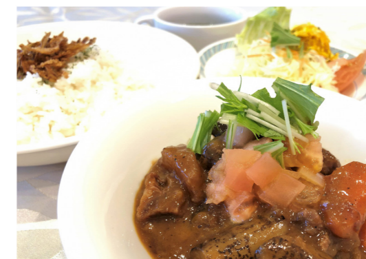
洋風牛すじ煮込み 880円 (ライス・スープ・サラダ付)

また、昨年10月におすすめメニューとして提供していました「牛すじカレー」、「牛すじラーメン」各850円を、ご好評につき復活いたします。前回食べたという方や、前は食べそびれた方も、この機会にぜひご賞味ください。