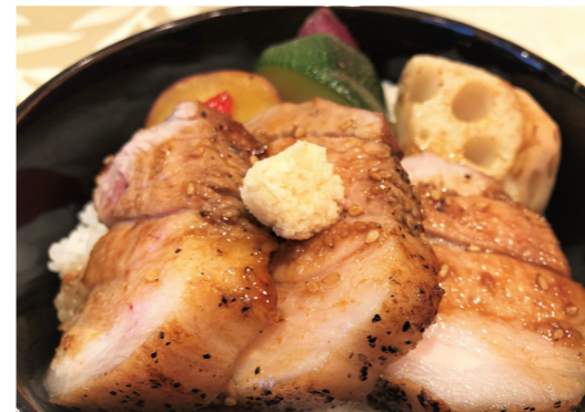
厚切り豚丼 980円（サラダ・スープ付）

今月のメニューは、彩り野菜と国産の豚バラ肉を厚みたっぷり切り、料理長特製のコチュジャンだれで味付けした「厚切り豚丼」と、流水昆布うどんを使い、だしの風味豊かに仕立てた寒い季節にピッタリの「鍋焼きうどん」です。 寒い季節におすすめのメニューをぜひお楽しみください。 また、ご好評につき、先月のおすすめメニュー「牛すじカレー」「牛すじラーメン」は今月も継続いたします。