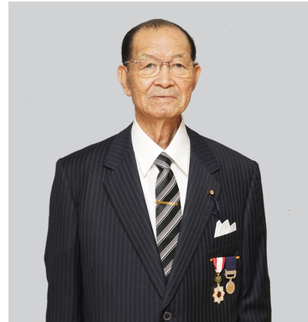
自治功労 元雄武町議会議員

平成3年5月に地域住民から強く推されて雄武町議会議員に初当選。以来7期連続で当選され、平成29年12月までの約27年の永きにわたって在職し、多方面にわたって地方自治の振興に多大な貢献をされました。その功績が認められ、平成30年秋の叙勲を受賞されました。