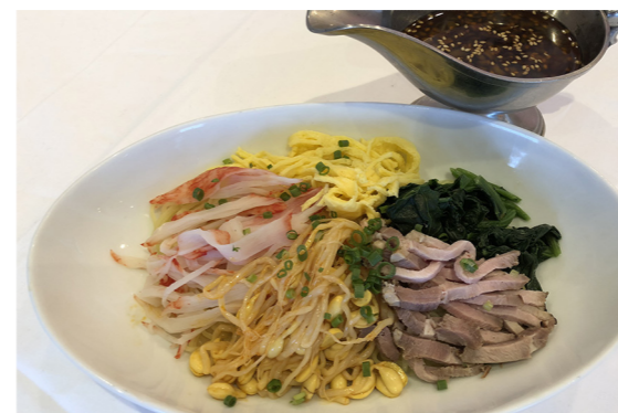
冷やしラーメン 800円

今月のメニューは夏にピッタリ! 冷やしラーメンと雄武町の名産『韃靼蕎麦(だつたんそば)』を使用した韃靼潮蕎麦(だつたんしおそば)です。温泉で汗を流したあとは、冷たいメニューをぜひご賞味ください。