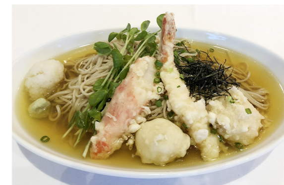
韃靼潮蕎麦(だつたんしおそば) 1,200円