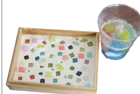
「ほうせきせつけん と せつけんおき」