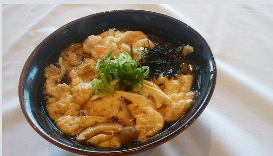
鮭の天ぷらとキノコのとじそば 750円

9月と言えば秋鮭が美味しい季節ですね。 今月のおすすめは秋鮭を使用したメニューをご用意しました。