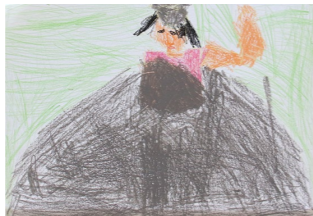
「おおたまころがし」