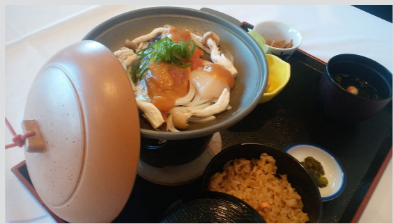
鮭のちゃんちゃん焼きと 鮭の炊き込みごはんセット 1,100円