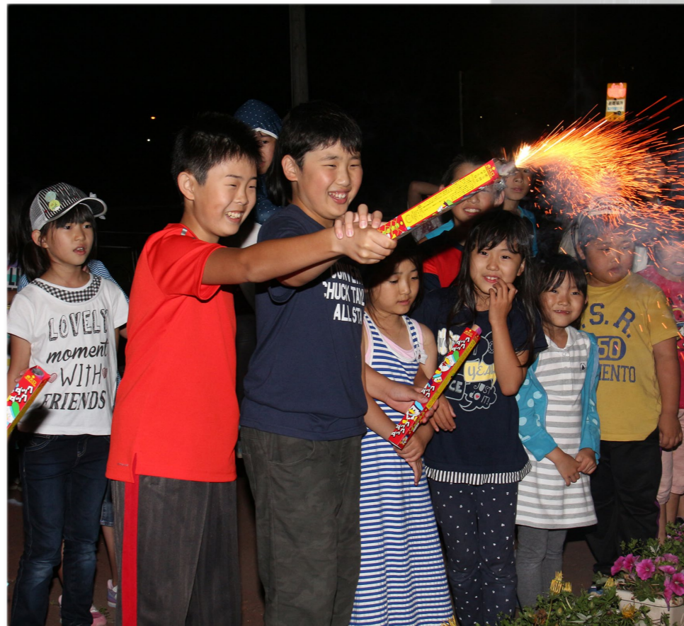
↓ 花火を楽しむ子どもたち