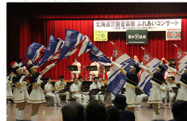
↓ 素晴らしい演技を披露するカラーガード隊