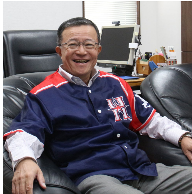
北海道日本ハムファイターズ 雄武町応援大使事業実行委員会

また開催してくれるなら参加したい、という回答がとても多く見受けられました。今回のツアーは皆さんにとって充実したツアーになったことがうかがえました。