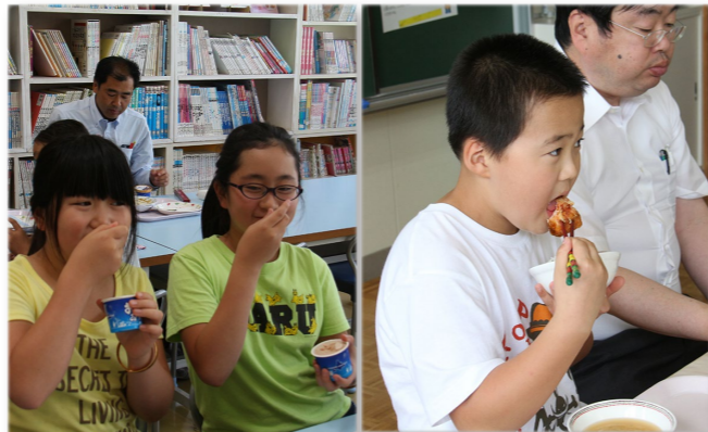
↓ 嬉しそうに給食を食べる子どもたち