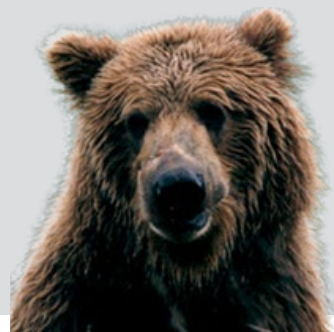
町産業振興課林務係