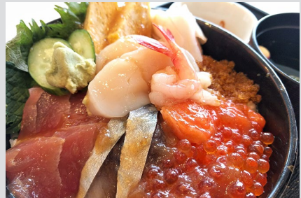
カニ入り天津飯 スープ、サラダ付 1,000円