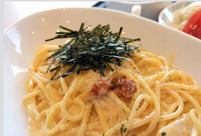
雄武産塩ウニのカルボナーラ スープ、サラダ付 1,200円