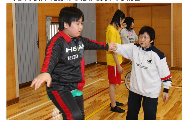
↓真剣な表情で講師から指導を受ける参加者