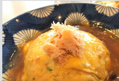
日の出岬特製海鮮丼 小鉢、吸物付 1,500円