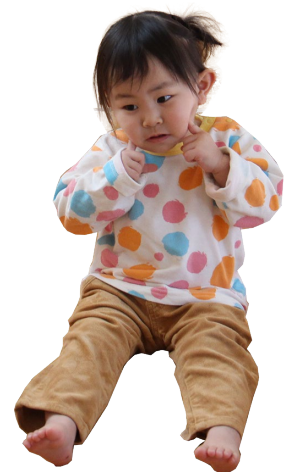
こんのう あさちゃん