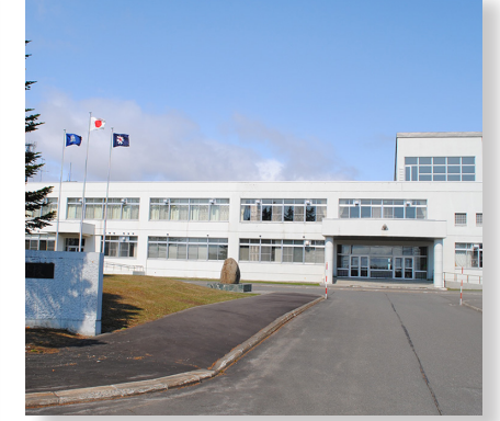
雄武高等学校存続対策事業 予算額 435万円