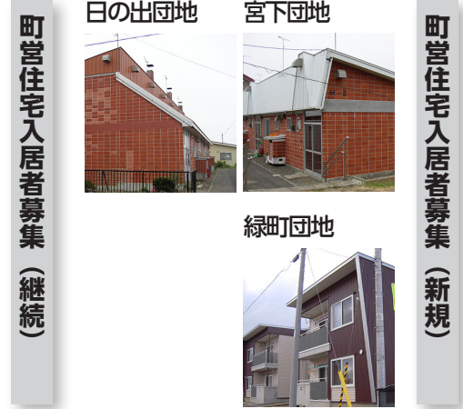
町営住宅入居者募集 (継続)