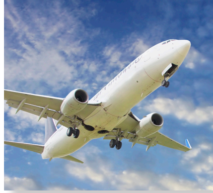
雄武町オホーツク紋別空港利用促進事業 予算額 3,833万円