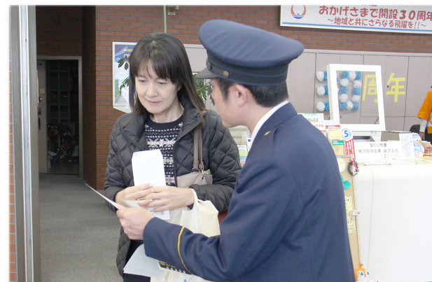
↑興部警察署員から説明を受ける来店者

稚内信金雄武支店の開設30周年を記念した特別イベントとして、野菜の詰め放題まつりが行われました。また、興部警察署と連携し、近年巧妙化する振り込め詐欺などの被害防止を目的とした啓発活動も同時に実施。署員2人が「最近手口が巧妙化し、電話だけでなく訪問して現金を請求する場合もあるので警戒をお願いします」と来店者へチラシを配りながら、注意を呼びかけていました。