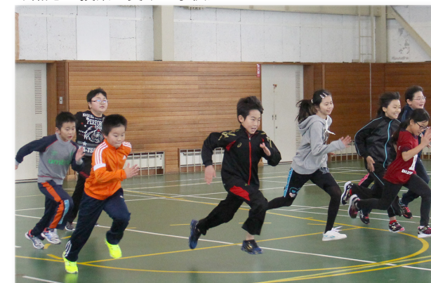
↓熱心に授業を受ける子供たち