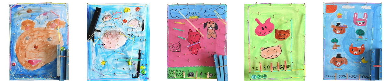
「手作り スマートボール」