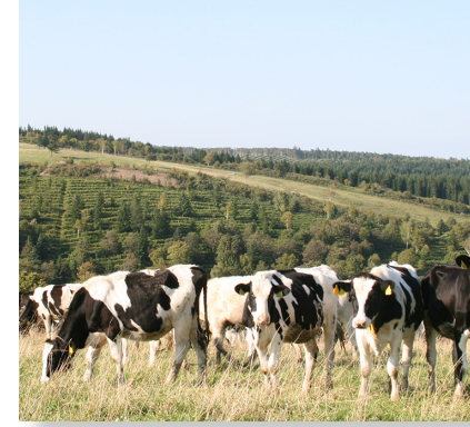
農業経営改善等対策事業 予算額 684万円