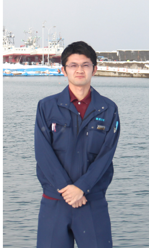
雄武漁業協同組合勤務