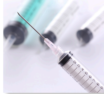
予防接種事業 予算額 1,210万円