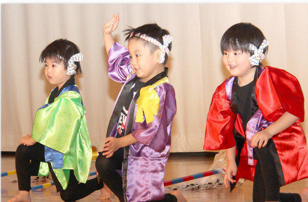
↓元気よく踊りを披露する園児たち

手作りの作品を展示販売するハンドメイドマーケットが、のびのび遊遊ランドで開かれました。町商工会空き店舗活用チャレンジショップ事業として実施したもので、町内外から7人が出店。血や茶わん、手袋やネックウォーマーなど、創意工夫を凝らした一点物の商品が店頭に並べられ、多くの町民などが訪れました。出展者からは「お客さまと会話をしながら販売するのは楽しい」「一生懸命作ったものを喜んでもらえるのが励みになる」などと話していました。