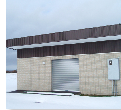
日の出岬整備事業 予算額 2,455万円