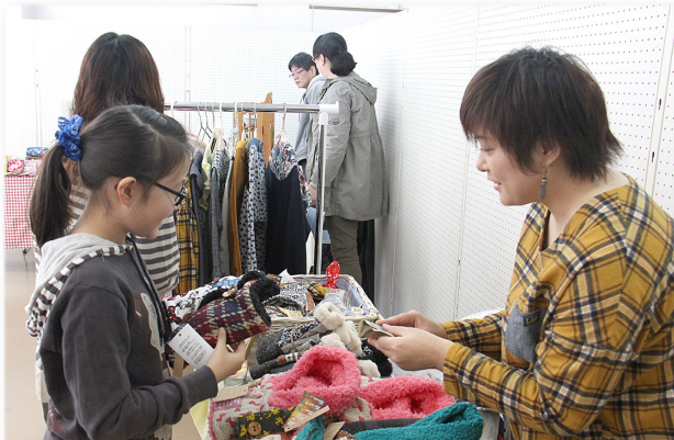
↓来場者へ商品の説明を行う出展者