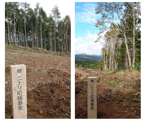
↑幌内地区 ↑上幌内地区

町では、森林の有する多面的機能を適正に発揮させるため、町有林の造林を計画的に実施し、森林資源の保全と整備、町有財産の造成を図っています。本年度は、ニトリ北海道応援基金の助成を受けて、上幌内、幌内の町有林にアカエゾマツ、カラマツを植栽しました。 ニトリ北海道応援基金とは、株式会社ニトリが行っている社会貢献事業で、北海道に「元氣を取りもどしたい」という思いから創設された基金です。株式会社ニトリでは、北海道1千万本植樹計画を掲げ、20年掛けて各地に1千万本の植樹を行うことを目標とし、地域の活性化や地球温暖化防止や環境保護植樹活動を