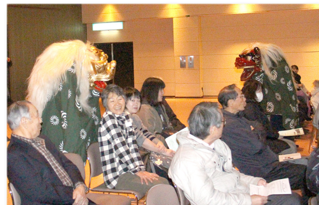
↑「寿獅子」に頭をかまれる来場者

伝統芸能の継承や普及を目的に活動している函館市のNPO法人・民族歌舞団こぶし座の公演が町民センターで行われました。全国各地に伝わる伝統音楽や踊りなどが次々と披露され、東京都葛飾区に伝わる「寿獅子」では、舞台から降りてきた獅子が観客の頭にかみつく場面も。獅子に頭をかまれると良いことがあると言われており、来場者は間近で見る獅子の迫力に、大きな拍手が沸き起こっていました。