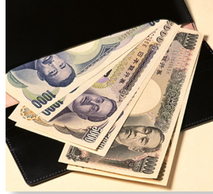
低所得者の高齢者向け年金生活者等支援臨時福祉 給付金事業 予算額 2,032万円