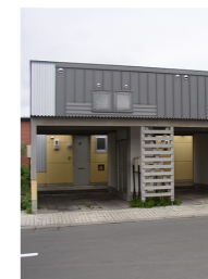
2戸 1LDK 平成5・6年建設 家賃 3万円

申込期限 10月17日(月) ※住宅使用料の支払いは、納付書での納付と口座振替があります。 ※住宅の情報は町公式ホームページでも公開しています。また、入居申込用紙のダウンロードサービスも行っています。