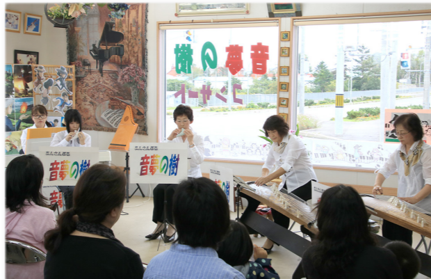
↓それぞれの楽器の音色を楽しんだコンサート