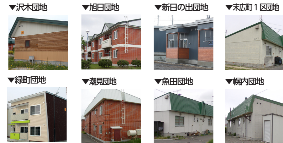
▼沢木団地 ▼旭日団地 ▼新日の出団地 ▼末広町1区団地 ▼緑町団地 ▼潮見団地 ▼魚田団地 ▼幌内団地