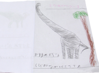
「きょうりゅうずかん」