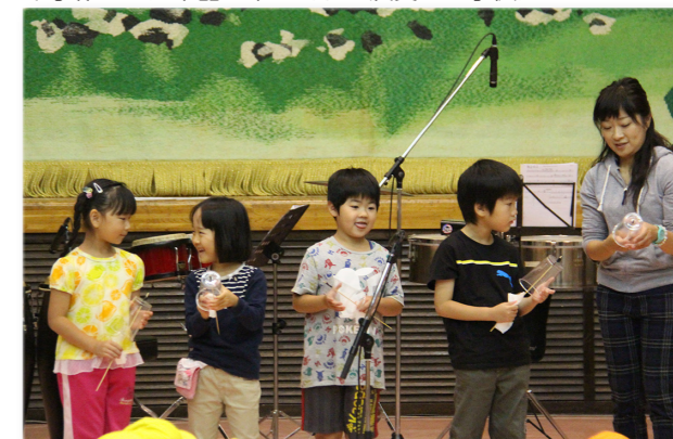
↓手作りした楽器で楽しそうに演奏する子供たち