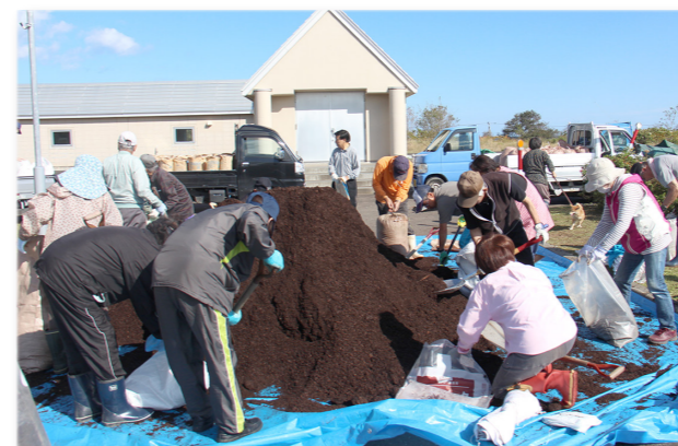
↑肥料「おうむ1号」を袋に詰める来場者

日常生活から出た「汚水」の処理過程を知ってもらおうと、雄武浄化センターで一般開放が行われました。浄化センターでは、微生物の働きを利用してきれいな水によみがえらせており、その様子を知ってもらおうと毎年行われています。また、浄化する中で発生した汚泥を資源として、有効活用するために肥料化した「おうむ一号」も併せて配布され、多くの人が訪れ肥料袋などに詰めていました。