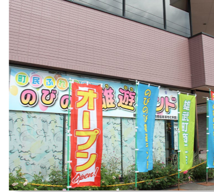
(商工費) 空き店舗活用事業 支出済額 300 万円