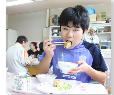
(教育費) 学校給食子育て支援事業 支出済額 358 万円