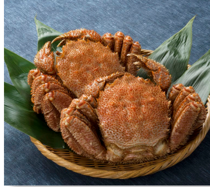
(総務費) ふるさと応援事業 支出済額 4,860 万円