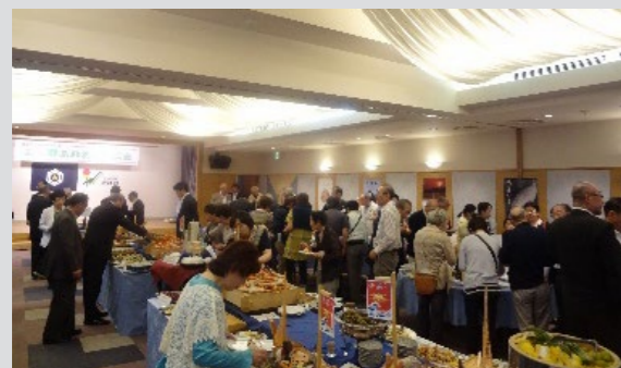
↑昨年度の交流会の様子