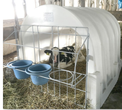
(農林水産業費) 農業経営改善等対策事業 支出済額 774 万円