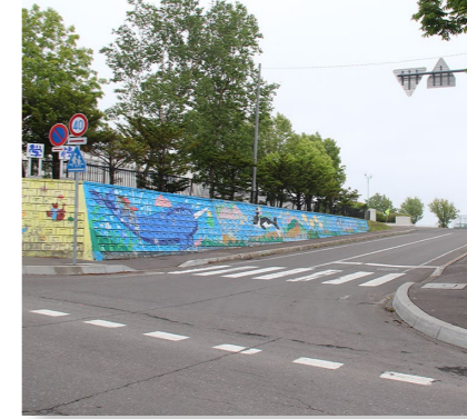
(土木費) 雄武小学校線道路改修事業 支出済額 2,225 万円