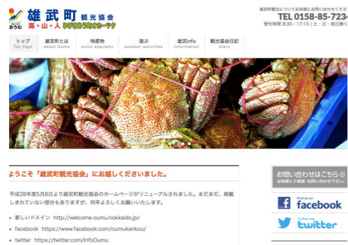
↑リニューアルした観光協会 Web サイト

雄武町観光協会の Web サイトが、5月10日からリニューアルしました。 http://welcome-omu.hokkaido.jp/ が、新しいメインとなり、Hokkaido という地名を入れることで、すぐさま北海道の町だと気づいてもらえるようにしました。Welcome - omu にも、「雄武町にようこそ」という気持ちを含めました。コンテンツ（内容）はさまざまです。今後、雄武町に来てくださる方に、雄武の情報がすぐわかるような記事をたくさん書いていきたいと思っています。観光協会ですぐさまフェイスブックやツイッターに発信されるように工夫を施していま