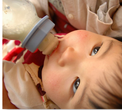
(民生費) 児童手当支給事業 支出済額 5,895 万円