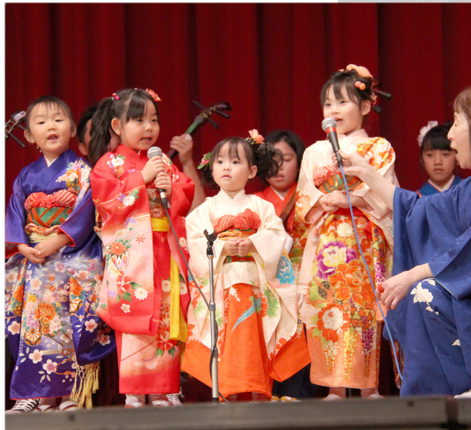
↓ 民謡を披露する雄武北誠会の子供たち