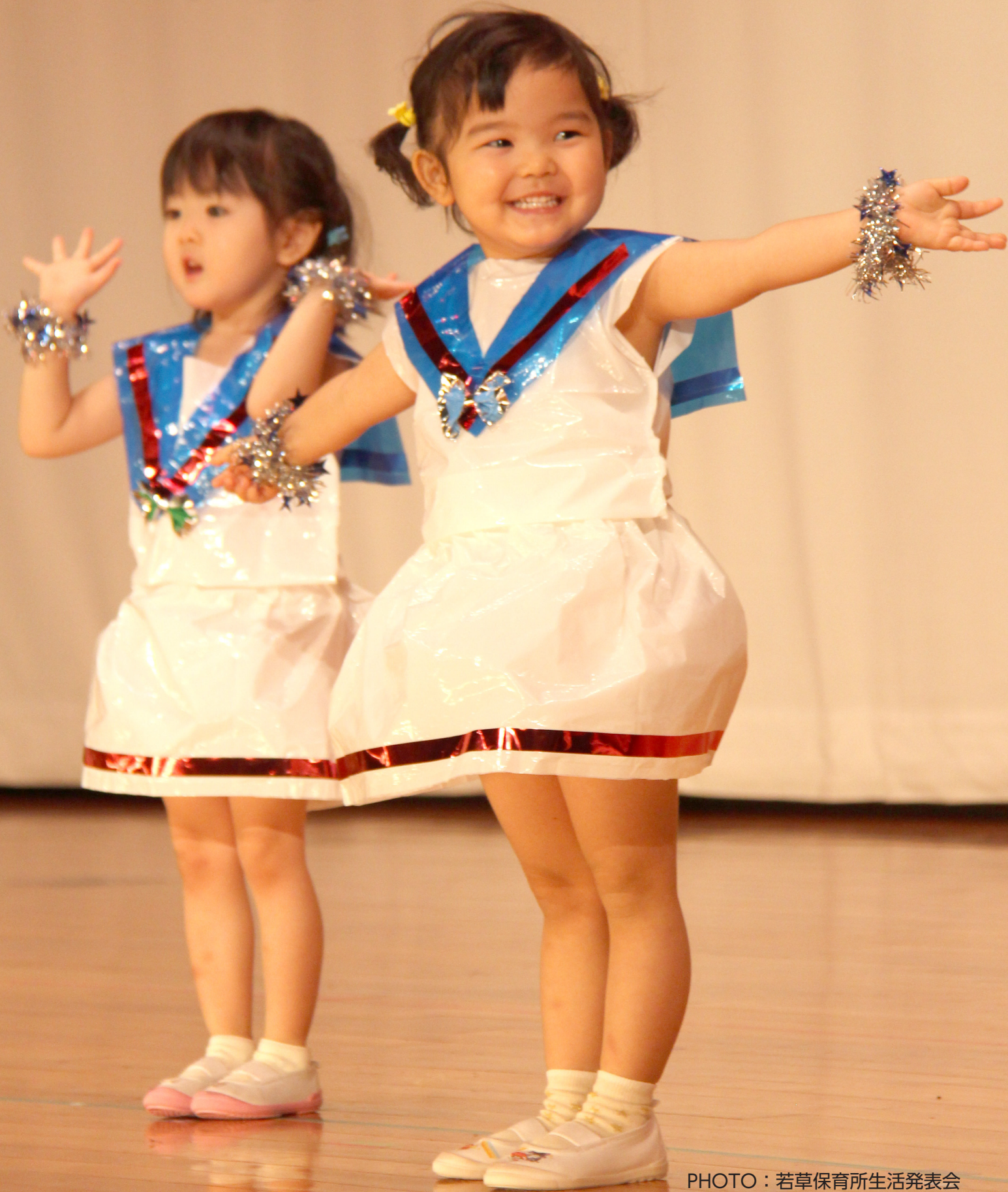
PHOTO : 若草保育所生活発表会