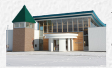
子育て支援センター（若草保育所内） ☎84-4366

子供は人から何かをしてもらっても、すぐにお礼の言葉が出ないことがあります。そんな時つい「なんて言うの？」「どうもありがとうは？」と大人が強要してしまっていることはありませんか？感謝の気持ちがないわけではありません。とっさに出てこなかっただけかもしれません。自分から素直に気持ちを表現できるよう、大人も「待つ」ゆとりをもちたいですね。