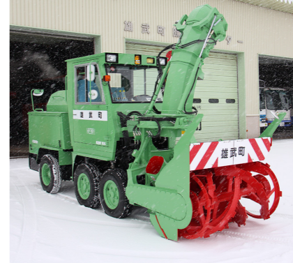
建設機械整備事業 予算額 2,530 万円