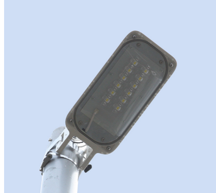
防犯灯 LED 化整備事業 予算額 589 万円