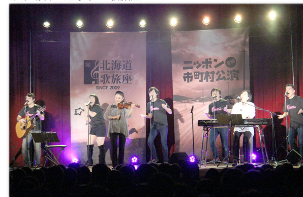
↓ 来場者を魅了する歌旅座のメンバー