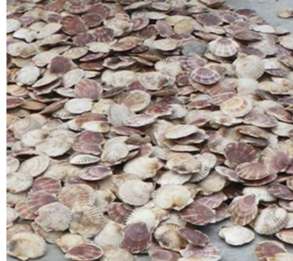
ほたて被害緊急支援事業 予算額 6 億 9,488 万円