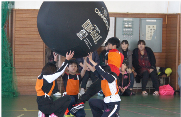
↓ ボールをセットしサーブを打つ児童