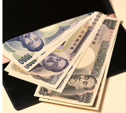
臨時福祉給付金給付事業 予算額 776 万円