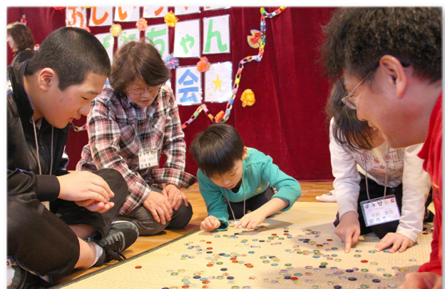
↑ おはじきで遊ぶ児童たち

共栄小学校で地域住民との交流を目的とした「おじいちゃん・おばあちゃんとの交流会」が行われ、児童とお年寄りはボウリングやクイズ、調理実習などを通じ交流を深めました。 はじめは少し緊張していた児童たちも、時間がたつにつれ笑顔も見られ、昔の遊びタイムではおはじきやけん玉などを熱心に教わりながら、昔ながらの遊びに夢中になっていました。