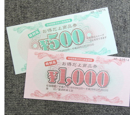
商業活性化推進事業 予算額 3,014 万円