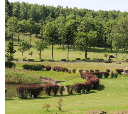
パークゴルフ場整備事業 予算額 300 万円