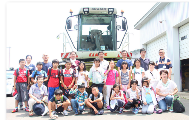
↓トラクターの前で記念撮影する益子町の児童