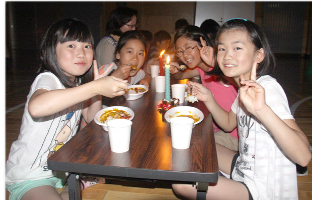
↓ロウソクの明かりのもと、手作りカレーを食べる子供たち