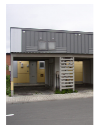
3戸 1LDK 平成5・6年建設 家賃 3万円