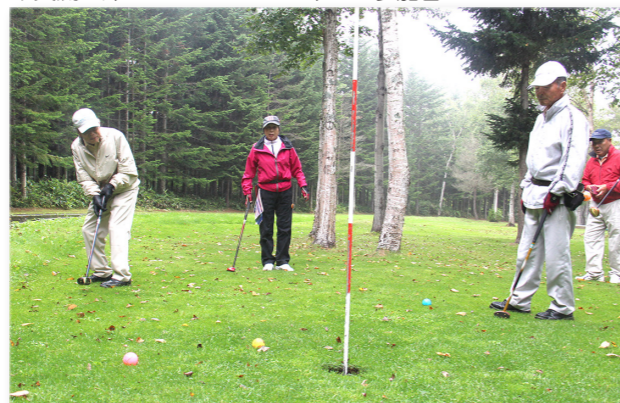
↓交流を深めながらプレーを楽しむ参加者