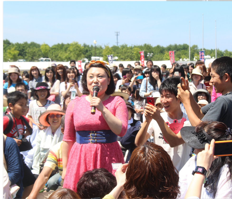
↓フォーリンラブのトークショーに盛り上がる来場者

雄武高校陸上部がボランティア清掃活動を行いました。この活動は、日ごろ練習で利用している東浜町付近の海岸への恩返しの意味を込めて実施したもので、顧問の教諭と生徒11人が参加。生徒たちは、約2時間かけて45リットルのビニール袋10個分の空き缶やペットボトルなどを回収。「日ごろの感謝の気持ちを形にしたかった」と話し、環境の大切さを再認識しながら精いっぱい浜辺をきれいにしていました。