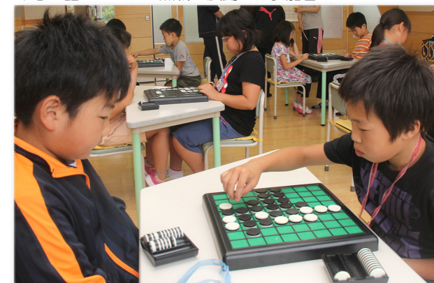
↓息の詰まるような熱戦を展開する参加者