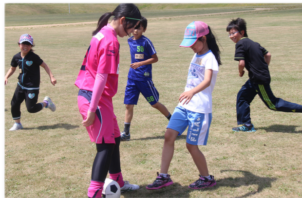
↑ミニゲームを行うノルディア北海道の選手と参加者

なでしこリーグ昇格を目指す女子サッカーチーム「ノルディア北海道」の選手4人を講師に迎え、雄武中学校を会場にサッカー教室が開かれました。(町教委主催) この日は小学生から大人まで26人が参加。講師からドリブルやパス、シュートの仕方などを教わり、最後は選手たちとミニゲームで対戦。子どもたちはグラウンドを元気に駆け回って接戦を展開し、「楽しかった」と笑顔を見せていました。