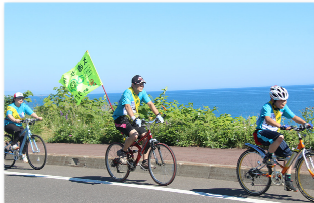
↓オホーツク海を臨みながら快走するサイクリスト