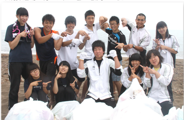
↓清掃活動を行った陸上部の顧問と生徒たち

初日の13日は晴天に恵まれ、道内外から参加した742人のサイクリストが花火を合図に町民センターをスタート。初日のゴールである北見市常呂町を目指し、オホーツクの自然を満喫しながら海岸線を快走していました。