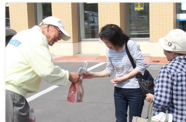
↑買い物客に啓発グッズを配布

啓発活動では、保護司会雄武支部の4人が道の駅周辺の買い物客などにクリアファイルやメモ帳などの啓発グッズを配布。地域全体で犯罪や非行の防止について訴えるとともに、社会を明るくする運動への積極的な参加や理解を求めています。