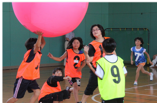
↑交流を深め合う沢木小と益子町の児童たち

雄武町への訪問は今年で15回目。益子町の児童たちは雄武漁協でホタテについて勉強したのち、沢木小児童との交流を行いました。また、日の出岬では浜遊びをしたほか、バーベキューで雄武町の味覚を堪能。「自然がいっぱいでビックリ」「海がきれい」などと雄武町の印象を興味深く話していました。