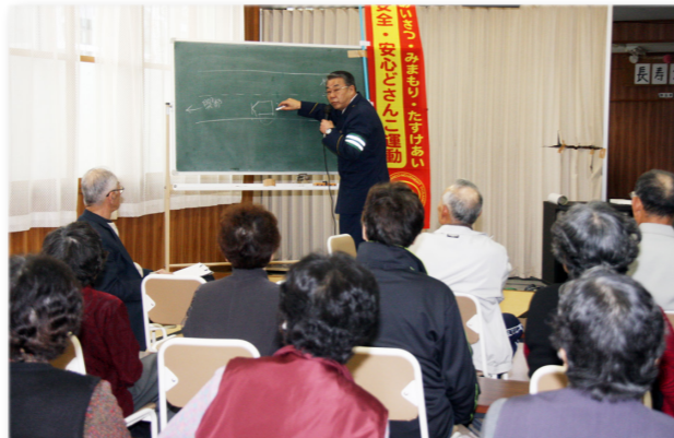
↓羽澤所長から説明を受ける長寿クラブの会員