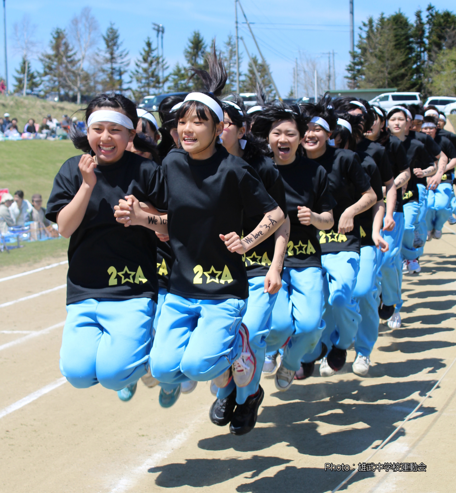
Photo : 雄武中学校運動会