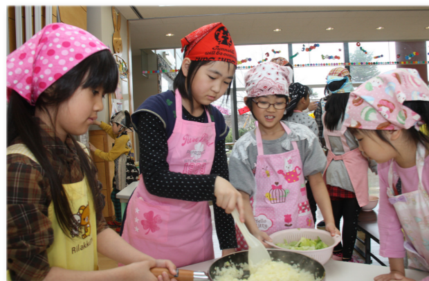
↑フライパンで具材を調理する子どもたち

45人の子どもたちが参加し、3つの班に分かれてハンバーガー作りを体験。職員に教わりながらトマトを切ったり、ハンバーグを焼いたり料理を楽しみながらオリジナルのハンバーガーが完成。子どもたちは、自分たちで作ったハンバーガーをみんなでおいしそうにほおばっていました。