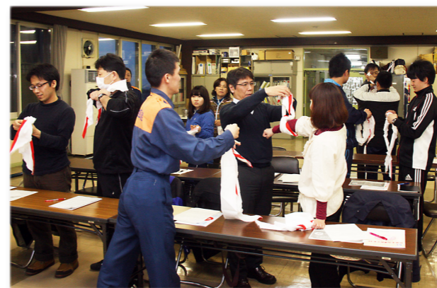
↑応急手当の実技に取り組む受講者

受講者は、指導者へ熱心に質問をするなど万が一の事態に備えた応急手当の対応方法を学んでいました。