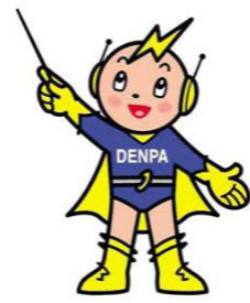
電波利用環境保護マスコットキャラクター「デンパ君」