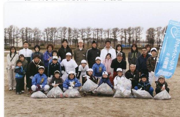
↓ごみ拾い終了後に記念撮影する参加者