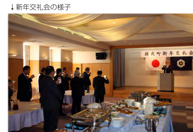
↓新年交礼会の様子