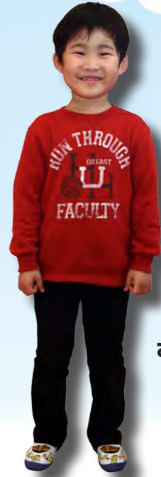
ハイパーレスキュー隊