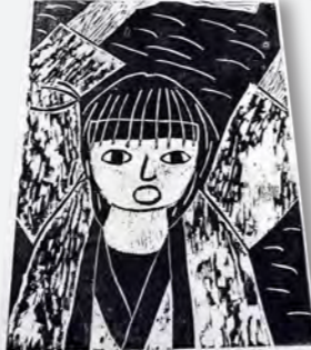
→「よきこいを踊っている自分」