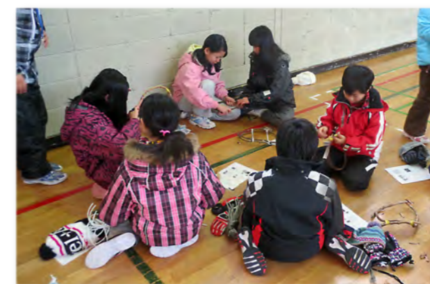
↑『かんじき』作りに挑戦する子どもたち

1月11日からの2日間、西紋地区5市町村の子どもたちが集まり、集団生活を体験する、あいすパラダイスが紋別市立オホーツク青年の家で開催されました。雄武の子どもたちは他市町村の参加者と一緒に、雪の上を歩くための道具『かんじき』作りや人が乗ったそりを引きリレー形式でタイムを競うスレッドリレーを体験。2日間の活動を通して、他市町村の子どもたちと交流を深めました。