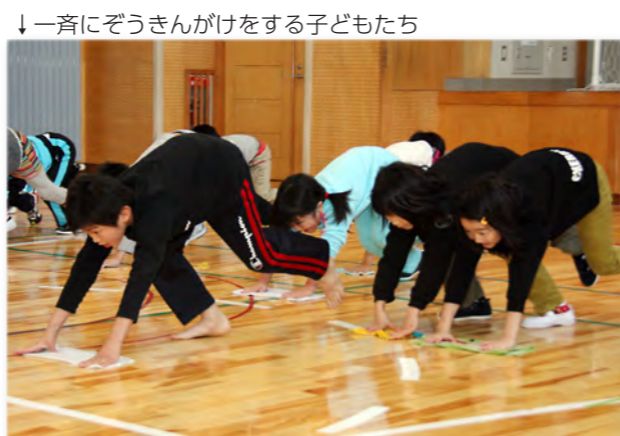
↓一斉にぞうきんがけをする子どもたち

その後、消防支署内で地域防災に貢献した消防団員に対する永年勤続表彰などの伝達式が行われ、来賓の方々の激励を受けた団員たちは防火に対する意識をよりいっそう高めていました。