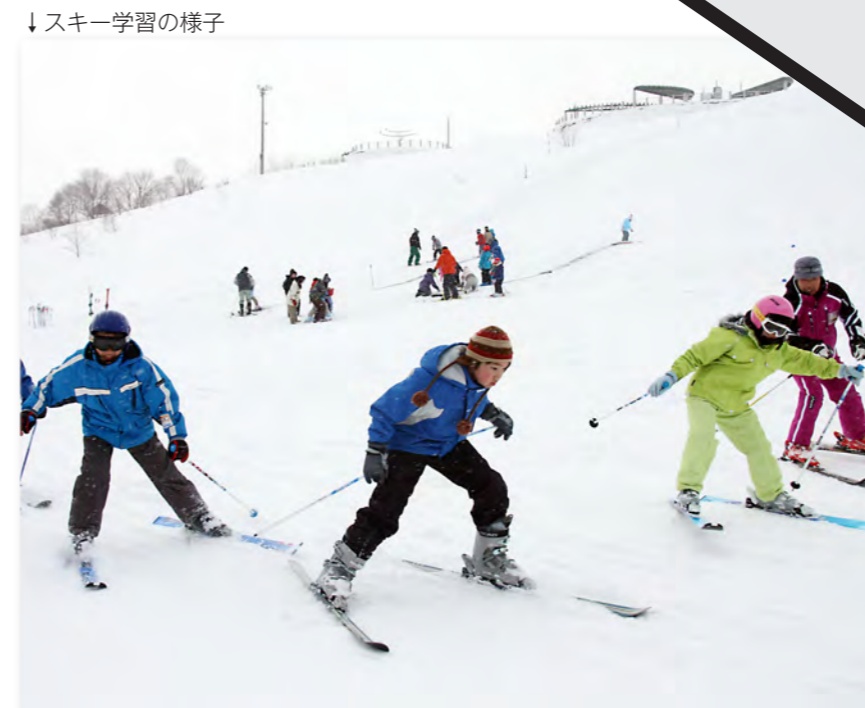
↓スキー学習の様子

最後は、遊戯室の床をみんなで一列になってぞうきんがけをして、いつも楽しく遊んでいる児童センターをピカピカにしました。