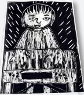
→「キーボードをひいている自分」