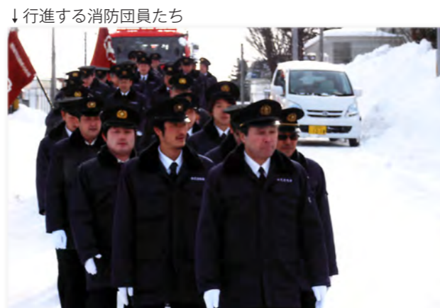
↓行進する消防団員たち