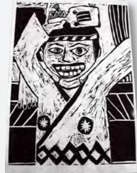
→「ソーランソーラン ぼくソーラン」