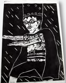
→「劇をしている自分」