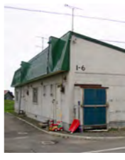
1戸 3DK 家賃:別表