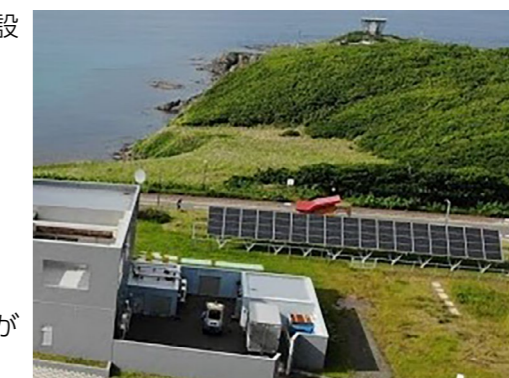
太陽光発電設備（ソーラーパネル）

令和元年度は、平成30年度より重油単価が若干下がったという要素があるものの、間違いなく使用量の削減に大きな効果が現れております。今後もホテル運営に有効活用してまいりたいと思います。